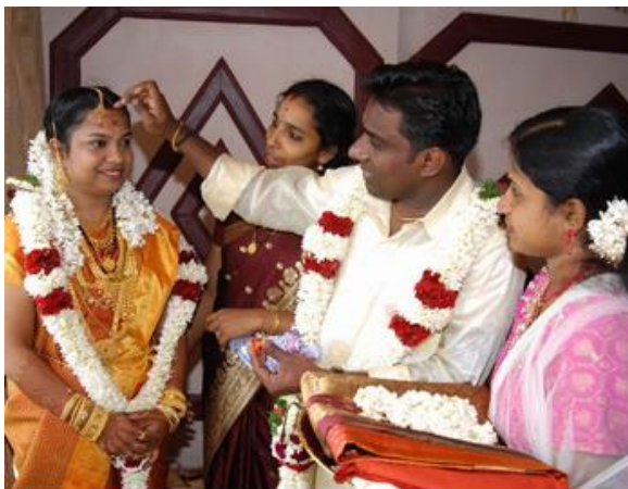
Id: Die Braut bekommt einen roten Punkt.